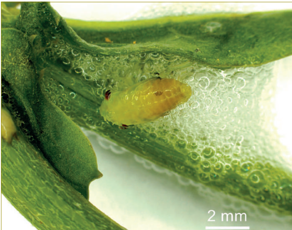
Figura 1 - Ninfa de afroforídeo - potencial vetor (original de F. Preza).

ficarem infetados. Contudo, não está provado que consigam ser vetores, ou seja, que estando contaminados com a bactéria a consigam transmitir a uma planta. Assim, estes não têm sido considerados como potenciais vetores.