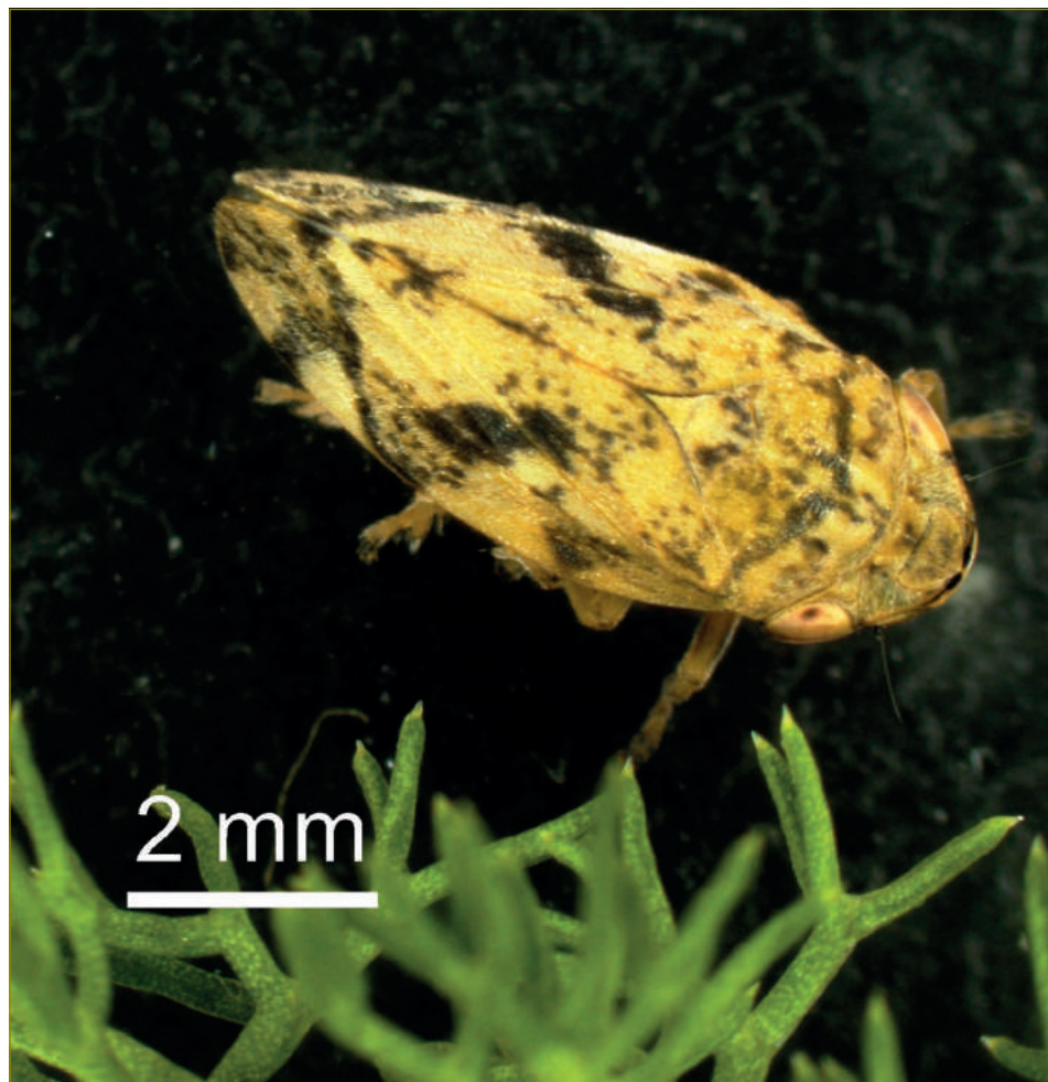
Figura 2 - Adulto de afroforídeo – potencial vetor (original de F. Preza).

No caso de o inseto ainda se encontrar na fase de ninfa, sempre que ocorre uma muda (ou ecdise), ele liberta-se da bactéria, já que o revestimento interno da zona onde a bactéria está aderente é a continuação (por invaginação) do revestimento